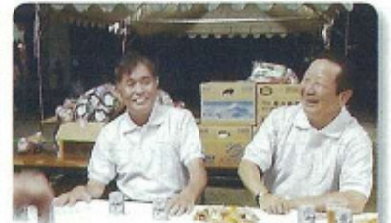
くれはフェスに市長・議長も来場