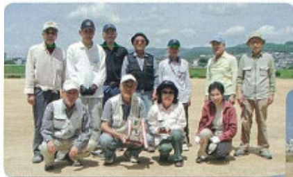
グラウンドゴルフメンバー