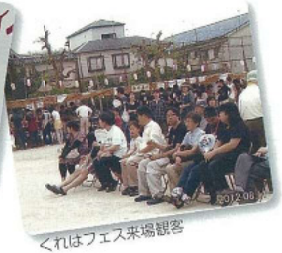
くれはフェス来場観客