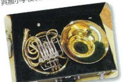
呉服小学校吹奏楽クラブへの楽器購入支援

26年度(平成26年4月～27年3月)の提案事業は検討中です。 ご意見をお寄せ下さい