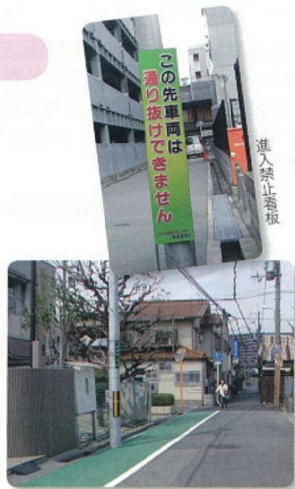
通学路グリーン舗装