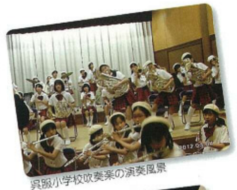
呉服小学校吹奏楽の演奏風景