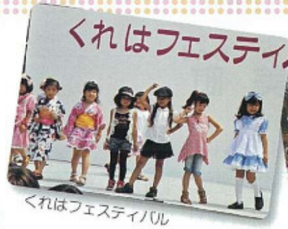
くれはフェスティバル