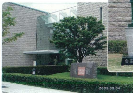
インスタントラーメン発明記念館と安藤百福翁像