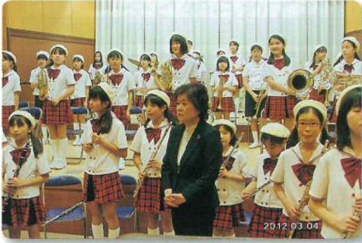
呉服小学校吹奏楽クラブ