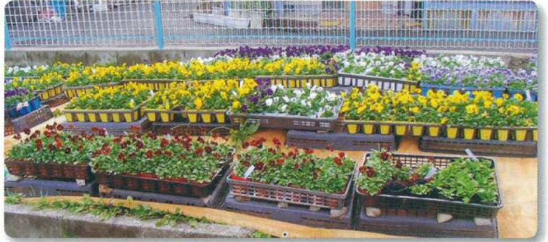
呉服小学校「花いっぱい運動」