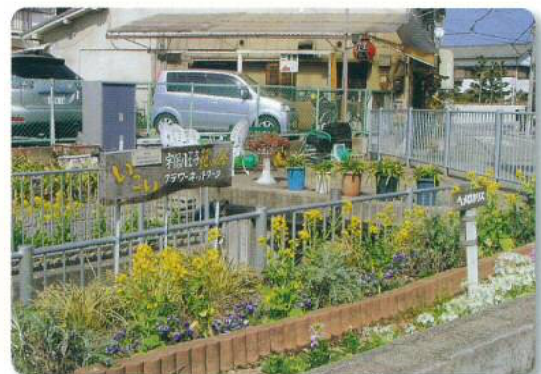
宇保フラワーネットワーク