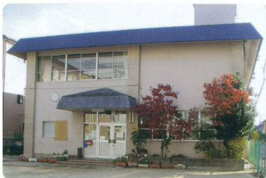
拠点となる呉服会館