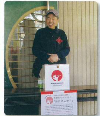
東日本大震災1億円募金