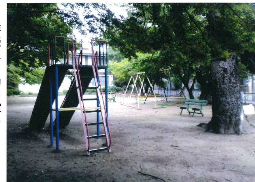
現在の早苗の森公園