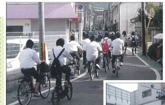
こんな運転していませんか？