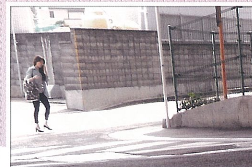
歩きながらのケイタイ