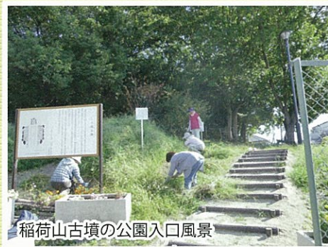
稲荷山古墳の公園入口風景