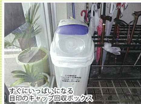
すぐにいっぱいになる 目印のキャップ回収ボックス