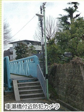
車瀬橋付近防犯カメラ