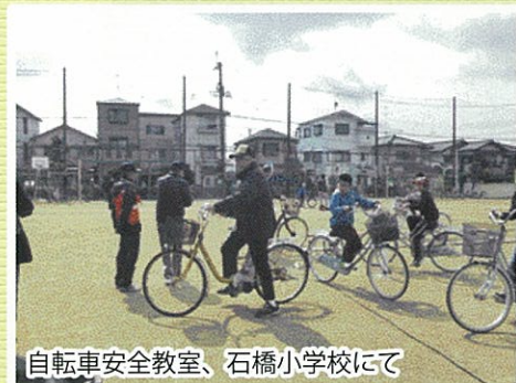
自転車安全教室、石橋小学校にて