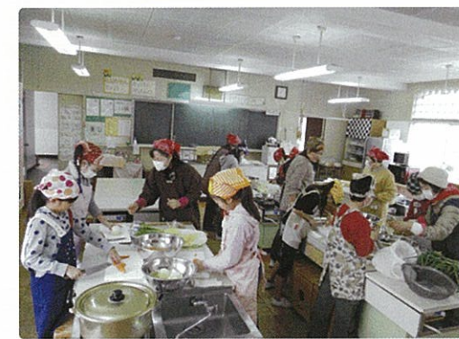
▲ 豚汁の具はこんなに沢山!