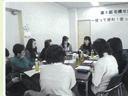
▲ 井口堂北会館大会議室、参加者の交流の場所でした

スマホは怖い? 怖くないの? 大阪府警のサイバー犯罪対策担当の方からお話をお聞きしました。現状はどのよう? 若いお母さん中心の雑談会となりました。子供たちはお母さんより上手くスマホを使いこなしているようで、頭の柔軟さ、適応性の早さに驚きました。機能をよく知って使えば便利なものと言えるようです。