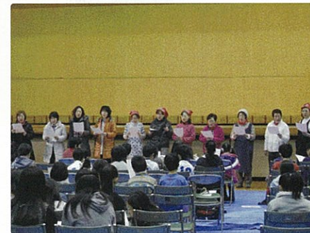
▲ 会場の皆の気持ちが一つに合唱!