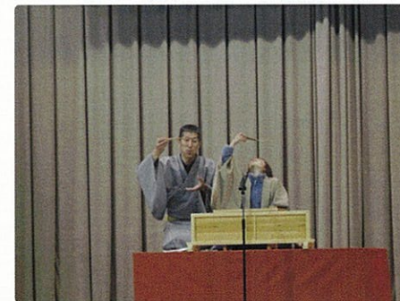
▲ 扇子がおそばに... つる~る~おいしそうに!