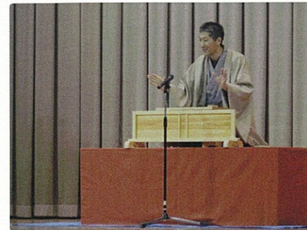
▲ 楽しいな! 古典落語