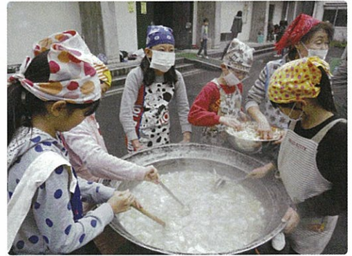
▲ 大きな鍋... 何人分かな!

皆で豚汁を食べました。 温かく、美味しい。 体の芯まで温まり 心の中も ホッカホッカ!