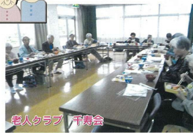
老人クラブ 千寿会