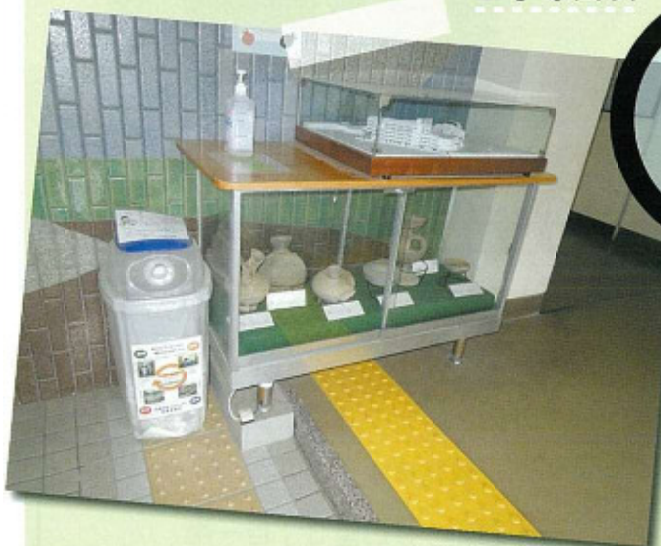
石橋古墳の出土品 石橋中学校所蔵