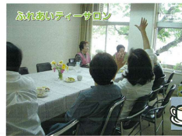
ふれあいティーサロン