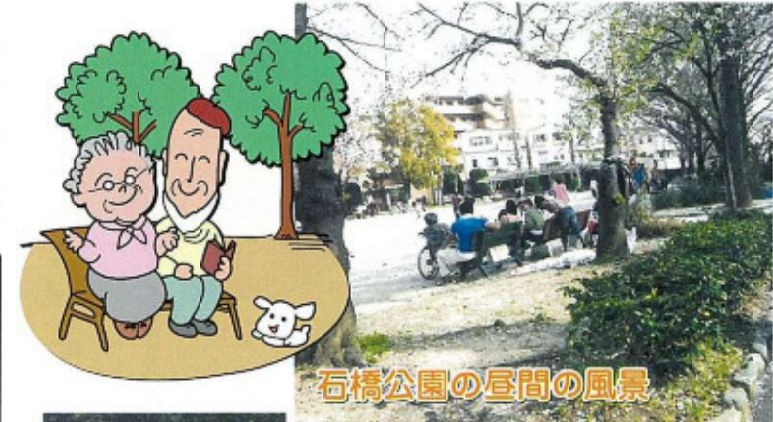
石橋公園の昼間の風景