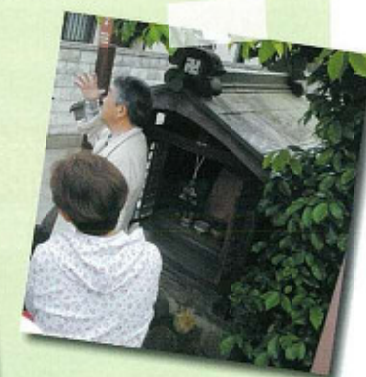
有馬街道 西国街道分岐点

歴史 特に考古学に精通されている先生から古墳のお話を聞き、皆の興味が沸いてきた所から、この探索は出発でした。 二子塚古墳、右大阪道しるべ、石橋古墳等先生の説明に耳を傾けたひと時でした。 この校区には歴史の宝物がこの他にもまだまだ在りそうでワクワクしました。 (参加者)