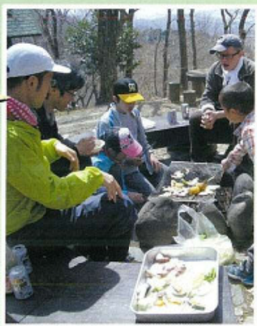
妙見山ハイキング