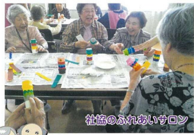
社協のふれあいサロン