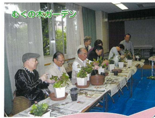
むくの木ガーデン