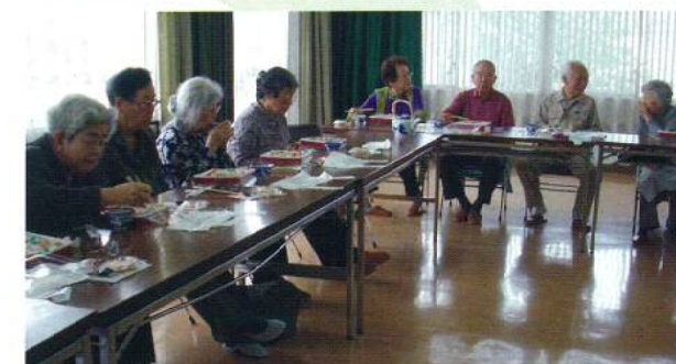
楽しいランチタイム風景

年4回の集会では、キーボードやハーモニカの伴奏をつけて合唱するのが一番のたのしみです。