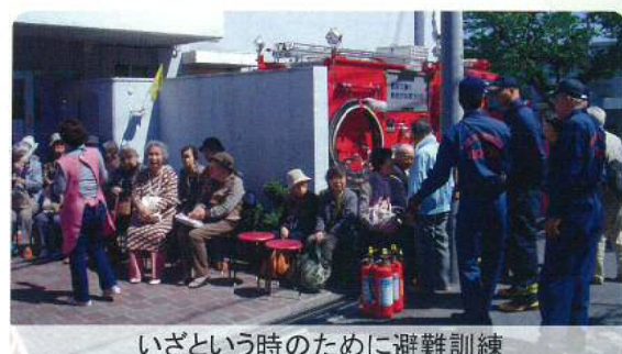
いざという時のために避難訓練

池田市内の11地区福祉委員会の1つです。現在40名余りの委員で活動しています。 ふれあいサロン、すくすくクラブ、男性料理教室など地域ネットワークづくりに頑張っています。 池田市高齢者安否確認作業中です。 やさしい声がいきかう街をめざしています。