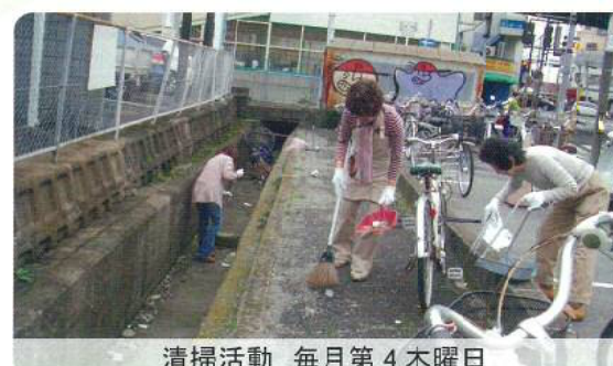
清掃活動 毎月第4木曜日

このような活動を通して地域での交流をしています。「健康で明るい地域社会の実現」がモットーです。