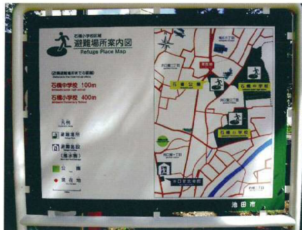
【石橋公園内・避難場所案内図】