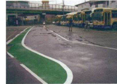
阪急バス車庫の通学路にグリーンベルトを延長しました。

道幅が狭く多くの人や車が往来している、まさに生活道路、通学道路が長年、石橋小学校PTA活動の安全点検活動にあがる危険場所になっておりました。ミラー設置条件をクリアするには私有地ぎりぎりには設置しなければならず、人や車の往来の妨げのない設置が必要でした。この件に関して、近隣の皆様の協力なくしては出来なかったと思います。今後も、このT字路は危険場所には換わりません。スピードをひかえミラーを過信せず安全通行していただければと思います。