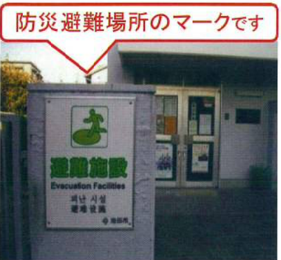
覚えておきましょう!