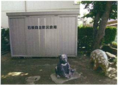
【井口堂北会館建物後方】