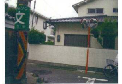
井口堂団地入口にミラーを設置しました。