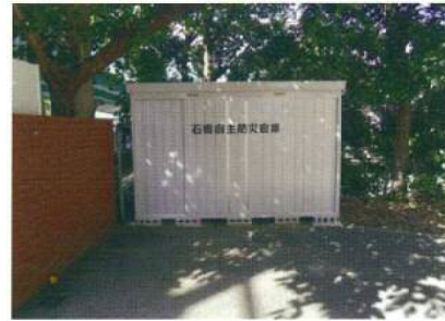
【石橋北会館玄関横】