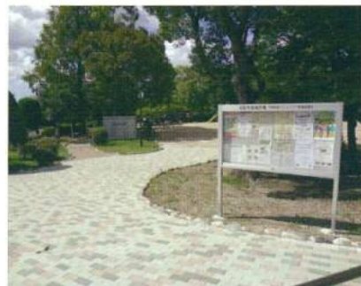
【石橋一内大型掲示板】

!!!!!!!!!!!! 私はいざ! という時のために !!!!!!!!!!!!!