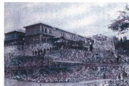
明治41年9月建石校舎落成