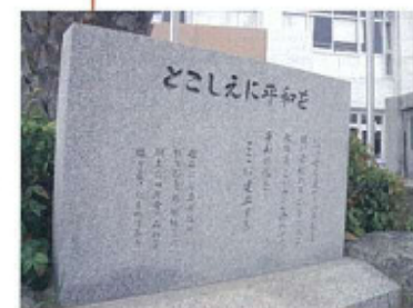
タイムカプセル覚えていますか

心のふるさとである美しい池田の自然、五月山の明るい姿と猪名川のすずしいひびき、そして豊島野の芳しい香りを導き皆さんを朝夕はぐくみ育てる恵み豊かな山川を思い作曲しました 清水 修 『池小百年誌』より