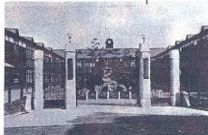
大正13年新築した校舎正門と登龍門碑