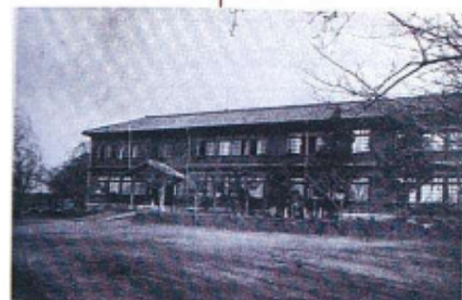
第一小学校校庭中央に登龍門