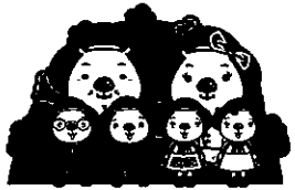
ふくまるファミリー

池田地域コミュニティ推進協議会は、平成23年7月から新しい体制で事業を展開することになりました。新体制では、4種類の部会と事務局を設置しました。新体制は2面をご覧ください。