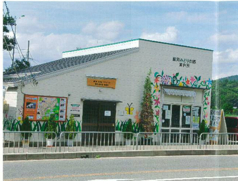
みどりの郷 案内所