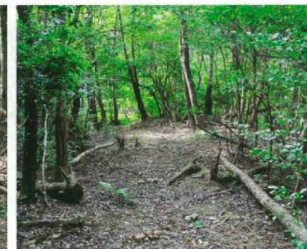
道標番号: 11までの道