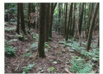
道標番号: 9まで急な登り坂