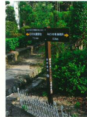
道標番号: 6 (次の三叉路を右に入る)