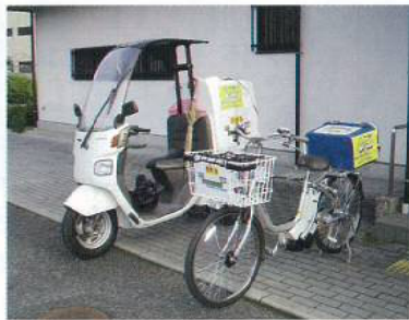
① 配食サービス用バイク