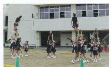
② チアリーダーディング

細河をより多くの人々に知ってほしいとの思いで、昨年度に引き続き今年度も十月二十三日(日曜)細河フェアを開催いたしました。早朝少し天候が悪かったにも関わらず大勢の方の参加があり主催側として大変うれしく思っていると同時に関大・阪大各スタッフ・協議会会員・市関係者・協賛団体・地域の協力店など大変広範囲の方々にもイベントを支えて頂き大変感謝しています。紙面にて厚くお礼申し上げます。 又、五月山日の丸展望台へのハイキングコース(木部ルート・中川原ルート)の整備が完了し、ハイカーには、ちょっとした登山気分が味わっていただけるものと思います。またハイキングマップも出来ましたので「細河みどりの郷観光案内所」に立ち寄りマップを手にハイキングを楽しんでください。