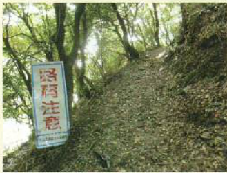
① コミュニティ道路

細河地域と伏尾台地域との交流を深め、親睦を図る目的でコミュニティ道路の整備をすることにしました。本事業は細河コミュニティと伏尾台コミュニティが合同で継続的に行っていく事業で、予算・施工方法等について協議検討をかさねてまいりました。現状は山道部分の転落危険箇所・非常に荒れた箇所等が数か所あり、本年度は先ず危険回避を優先に転落防止工事から着手しました。通路は木質可熱アスファルトにし滑りにくい仕上げにしています。十一月下旬に久安寺の北側にグラウンドゴルフ場が完成しました。是非コミュニティ道路を利用しグラウンドゴルフを楽しんで頂きたいとおもいます。 又、細小グラウンド用芝刈機を購入し円滑に芝管理作業が出来るようになりました。 今後とも、ご理解・協力をお願いいたします。