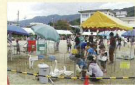
④ ⑤ ⑥ ⑦ ⑧ ⑨ ⑩ ⑪ ⑫ ⑬ ⑭ ⑮ ⑯ ⑰ ⑱ ⑲ ⑳ ㉑ ㉒ ㉓ ㉔ ㉕ ㉖ ㉗ ㉘ ㉙ ㉚ ㉛ ㉜ ㉝ ㉞ ㉟ ㊱ ㊲ ㊳ ㊴ ㊵ ㊶ ㊷ ㊸ ㊹ ㊺ ㊻ ㊼ ㊽ ㊾ ㊿