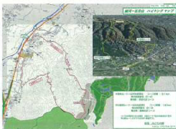
① ハイキング道マップ

今年度、地域コミュニティ紙の発行事業ですが七月一日に第八号を二十四年元旦に第九号を発行しています。相変わらず住民の方からの投稿は少なく推進協議会からの情報掲載が多く、もっとも興味を持ち見てもらえるコミュニティ紙になるように考えていく必要があると思っています。ホームページについては毎月、月初めに更新作業をし、広報紙で掲載できないタイムリーなニュース・イベント情報を公開しています。インターネットにて細河みどりの郷のホームページをご覧ください。細河観光マップ「すぐその細河」二万部が約二年でなくなり今年度五千部再発行いたしました。案内所に立ち寄られた際には、是非本マップをご利用ください。細河フォトコンテストを現在開催中です。二十四年二月十五日まで作品を受付けています。入選すれば賞状・豪華副賞を用意しています。また入選作品は次年度ポストカードにし、地元のお土産品とさせていただきます。どなたでも結構です、おおいに細河を散策してシャッターを押し応募して下さい。