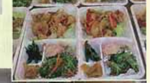
配食事業調理風景