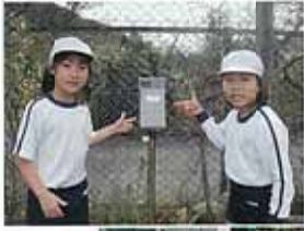
細小芝生自動灌水設備

本年度の教育部会の事業としまして、昨年からの二ヶ年事業として進めてきた細河小学校グラウンド芝生の灌水事業の二期目となります。今回で自動灌水事業は全て完了し、校庭の芝生については、人手による灌水作業に頼らなくてもよく、降雨の場合は自動的に動作が停止するセンサーも備えており、省資源に貢献できる優れたものです。次に子どもへの安全対策としまして昨年度子ども一〇番のステッカーや小旗等の更新をしてまいりました。今年度につきましては以前に作られた地域安全マップが地域の移り変わりとともに、見直しが必要となり本年度に調査を行い新しく地域安全マップを作製配布したいと考えています。又、専門の講師を招き、新しい地域安全マップを資料として、細河小学校体育館にて安全講習会を開催し子どもや保護者の方々に安全に対する意識の向上を図り地域全体で交通安全や犯罪ゼロの町になるよう願っております。