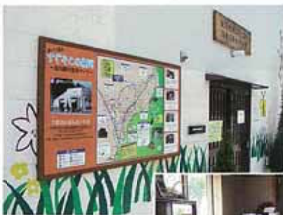
みどりの郷 観光案内所

細河みどりの郷案内所（細河地域コミュニティ推進協議会事務所）内部の改修を行いました。建物内は全てバリアフリー、事務室は合理的に作業が出来るようワンフロアーにし、関係先との打ち合わせ、来客対応、部内会議等も充分なスペースを設けました。又隣室の地産物展示販売室も展示棚を統一し、中央部は来客の休憩スペースを設け機能的又美観的に充実致しました。皆様是非お立ち寄り下さい。お待ちしております。