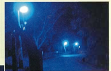
ブルーライト防犯街路灯

昨年度に引き続き三つの事業を計画しています。先ずは植木・野菜など植物に優しく、しかも防犯効果のある青色防犯街路灯(ブルーライト)を設置する計画です。設置した当初は光がブルー色のため明るさが弱く気味が悪い、等の様々な意見がありました。今では特に反対意見もなくなり、更に設置数を「増やして欲しい」との要望が寄せられております。昨年度同様に本年度も約三十灯を細河地域七地区に設置する予定をしています。次にホタルの育成事業については、昨年に引き続き池田自然を守る会の協力を得て、さらにホタルを繁殖させる予定をしております。シーズンには是非吉田橋周辺までホタル観賞に来てください。夏の細河の風物詩を楽しんで頂けるものと期待しています。 最後に住宅環境の改善事業として、樹木の剪定枝の処理活用問題ですが、専門講師を招き研究していく予定です。 今後、細河地域産業の一役ともなればとの思いにて、取り組んでいきます。住宅環境についてのご意見ご要望等、有りましたら協議会に申し出て下さい。