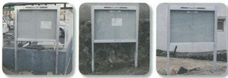
旭丘1丁目 渋谷3丁目 畑4丁目

地域コミュニティ推進協議会の活動内容のお知らせ・案内とともに、地域団体の使用にもできるように、掲示板設置事業を推進し、平成25年度は、旭丘・渋谷・畑の計10カ所に設置されました。