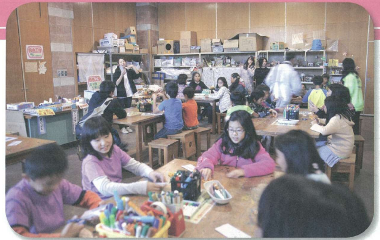
地域内子ども会等活動支援事業