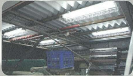
秦野小学校倉庫改修 (照明設置)