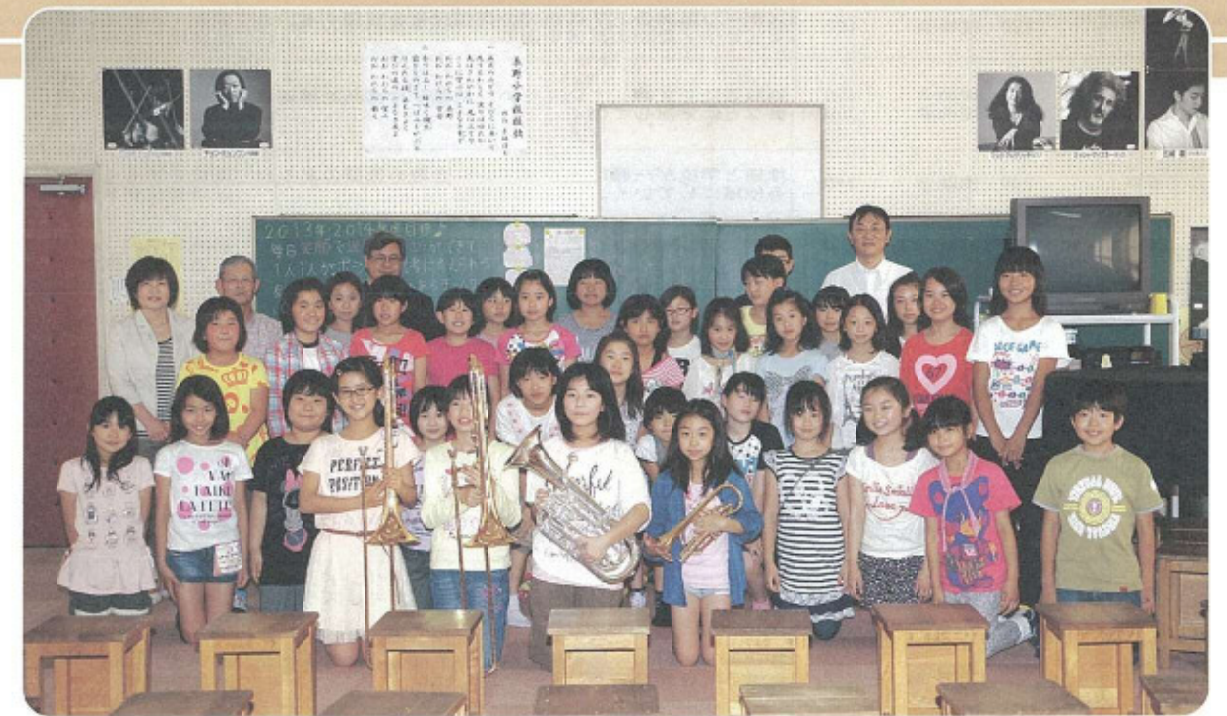
秦野小学校金管クラブ支援事業 楽器4点贈呈