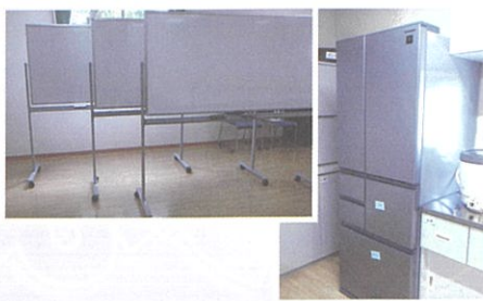
②会館備品整備事業(5月) (石橋会館に冷蔵庫・ホワイトボード)