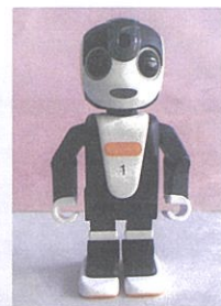
⑥多世代交流支援事業(6月) (石橋南小学校にロボホン導入)