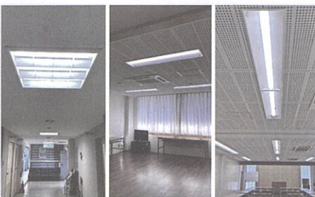
⑤会館設備改修事業(6月) (空港会館LED電灯設置・大会議室他)