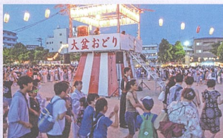
⑨地域行事等活動推進事業(7月) (石橋まつりやぐら関連整備)