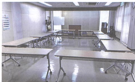
①会館備品整備事業(5月) (空港会館テーブル入替 10台)