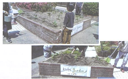
③石橋南地域花いっぱい運動支援事業(5月) (1回目)