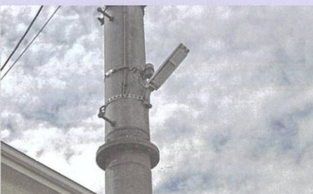
⑪街路灯強化事業(9月) (空港地区街路灯設置)