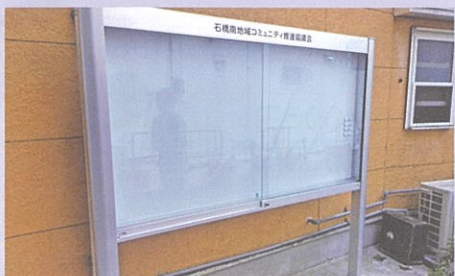
⑩地域掲示板設置事業(9月) (石橋商店街に掲示板設置)