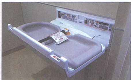
④会館設備改修事業(6月) (石橋会館トイレに横型おむつ台)