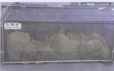
⑧ゴミ収集かご設置事業(7月) (石橋3丁目21地先にゴミ箱の設置)