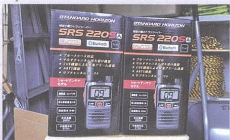
⑦防災体制強化等事業(7月) (空港地区にトランシーバー導入他)