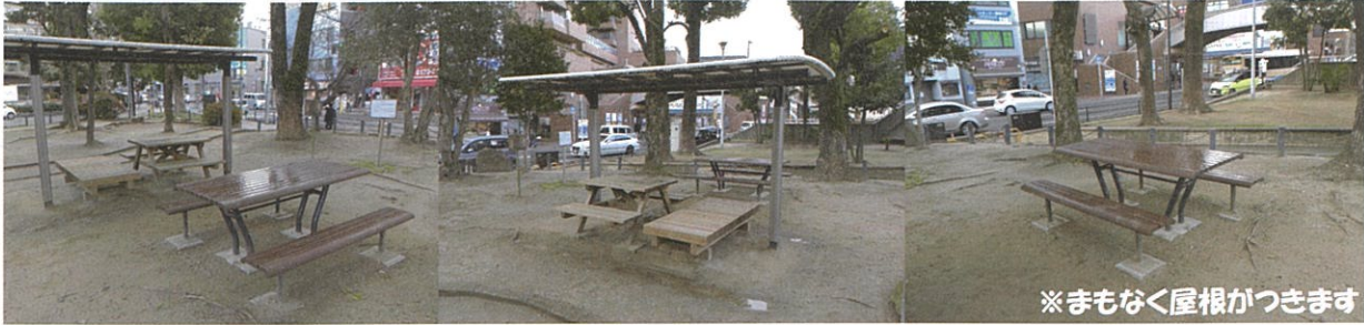
※まもなく屋根がつかます

数年前に池田駅前公園にあずまの設置事業を行いました。公園に立ち寄られる多くの方が休憩をしたり、お弁当を食べたりと地域の皆様の憩いの場になっております。