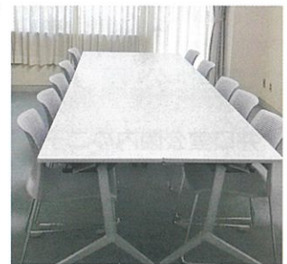
変更自由な椅子と机 (小会議室)

秦野会館は建物や備品が古く、痛みも目立っていました。この度、会議室の椅子や机、学習室のカーテンを新しく交換し、保育室の畳の張替えも行いました。このため使用環境が一新され、利用者の方々からは新しい、使い易い、明るく気持ちがいい、との声を頂いています。地域のコミュニティの場として気持ちよく利用できるよう、秦野会館の運営に地域の皆様の一層のご協力を宜しくお願いいたします。