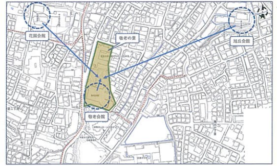
多世代交流施設の検討 (敬老会館、花園会館、旭丘会館の統合)