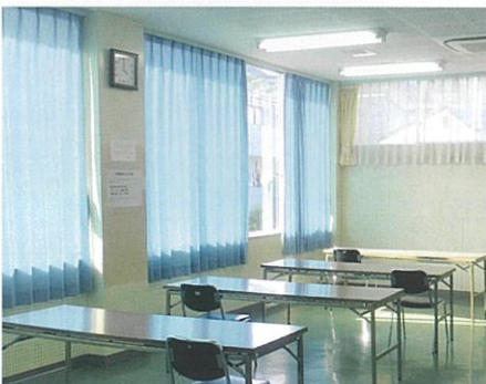
さわやかな青いカーテンの学習室