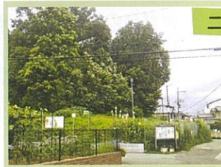
二子塚古墳全景(井口堂北会館の北側)

井口堂公園内の二子塚古墳をゆっくり見学したい、 そのためテーブルと椅子設置の強い要望を石橋地域 コミュニティ推進協議会から池田市に提出していま した。今般、池田市よりテーブルと椅子が設置され ることになりました。この機会に二子塚古墳を訪れ、地 元の歴史をしっかりと探索しましょう。