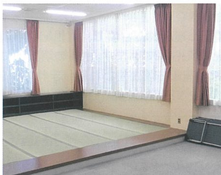
明るくいぐさの香る保育室