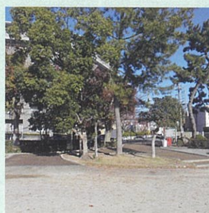
工事完了(広場付近)