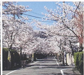
ロータリーを望む道