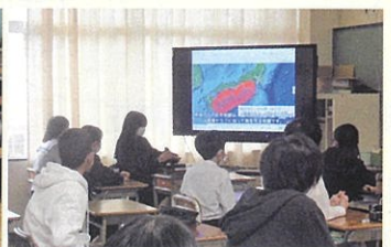
資料検討(南海地震)