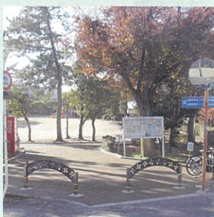
工事完了(公園北入り口)