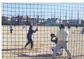
ソフトボール大会