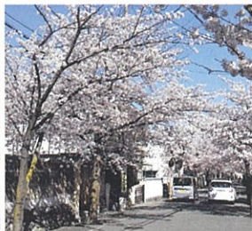
旭丘2丁目 桜並木入口付近