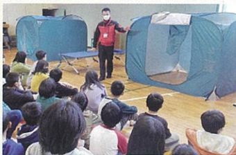
簡易間仕切りと簡易ベッド