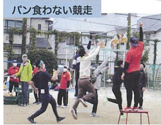
パン食わない競走