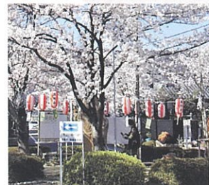
ロータリーの記念碑公園

桜並木の健全な管理の結果、毎年3月下旬ごろから、呉羽の里地域一帯で約270本の桜が咲き誇ります。記念碑公園では、桜が開花する期間にあわせ紅白の提灯でライトアップを行い、夜間の桜も楽しんでいただけます。今年も皆さん、地域を散策して桜のトンネルや咲き誇る立派な桜を楽しんで下さい。