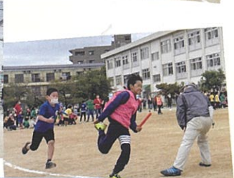
町別対抗混合リレー