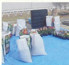
準備 (花・土・プランター、等)

3年生と石橋地域コミュニティ推進協議会・環境部会の皆さんが、石橋小学校の校庭に集まりました。まずまずの天候に恵まれ、環境部会から注意事項の説明後、皆でワイワイ言いながら協力してキンギョソウ、ピオラとパンジーをプランターに植え込みました。水やりをしっかりと行い、最後にブルーシートをたたみ、道具も片付けました。有意義な授業となりました。