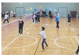
バトミントン大会

スポ振の心がけ ① 事前準備を徹底すること。② マンネリにならないこと。③ 参加者を増やすこと。