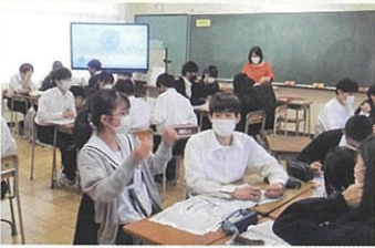
テーマの検討・議論