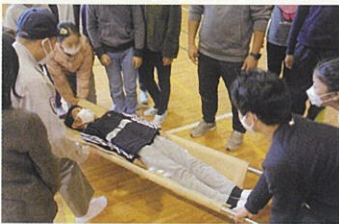
簡易担架の体験(小学校)