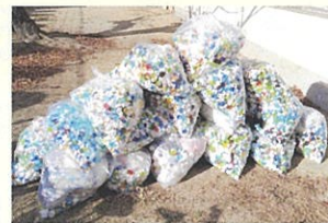
ペットボトルキャップの回収

コロナ禍ですが、回収作業は3年前の状況に戻りました。夏期と冬期の天候に影響されることなく、回収量は順調に伸びています。地域の皆様がこの活動に幅広く参加していただいていることにやりがいを感じています。身近な SDGs 活動にご協力をお願いいたします。