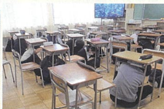
地震時の避難(中学校)