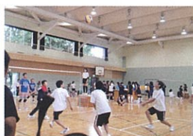
ソフトバレーボール大会