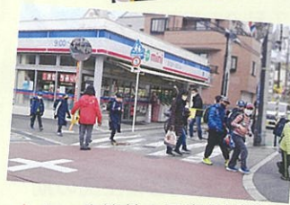
▲ ミニ生協前の見守り活動