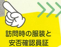
訪問時の服装と 安否確認員証