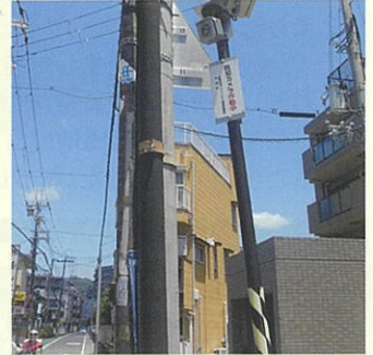
ミニ生協前交差点