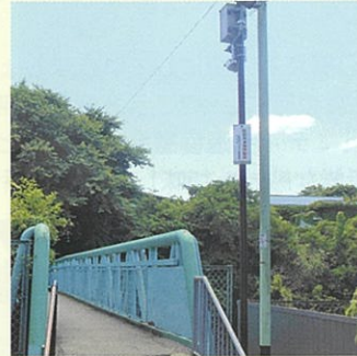
くるませ橋(青い橋)