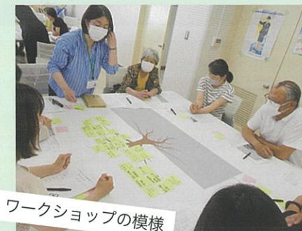
ワークショップの様