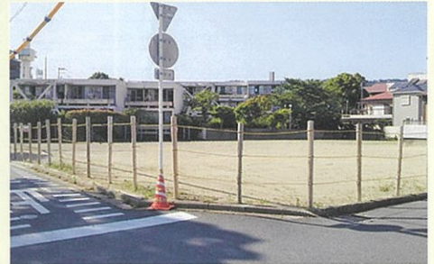
石橋保育所建設予定地(井口堂住宅地跡)