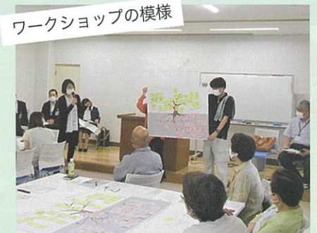
ワークショップの様