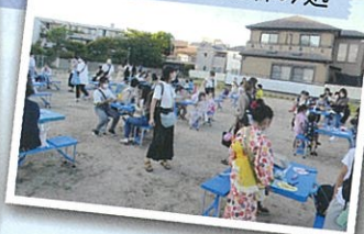
石小金管クラブ演奏