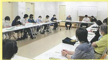
避難支援協議会の会議 (活動状況や課題等の検討)

なお、避難支援協議会の会議では運用時の様々な課題について意見交換を行い、地域の安全安心の支えになるよう努めています。