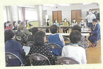
▲ 子ども安全見守り会総会