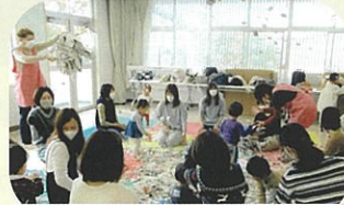
子育てサロン(ママと一緒に!!)