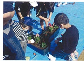
花と球根の植込み