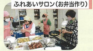
ふれあいサロン(お弁当作り)