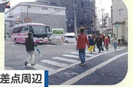
井口堂交差点周辺