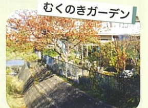
むくのきガーデン