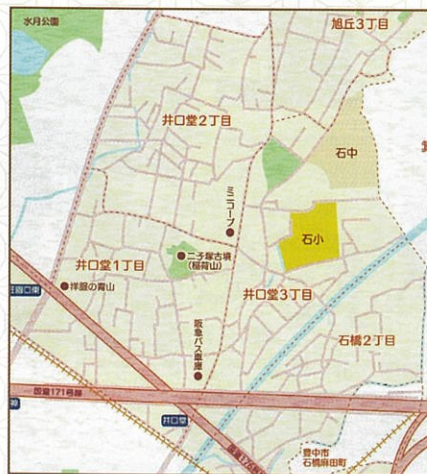
現在の井口堂周辺地域

明治時代の初めごろは、天神一丁目の北側をイグット(当時の井口堂の方言)と呼び、今の井口堂1丁目のほとんどをハタケナカ(畑中)と呼んでいました。