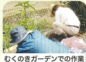
むくのきガーデンでの作業