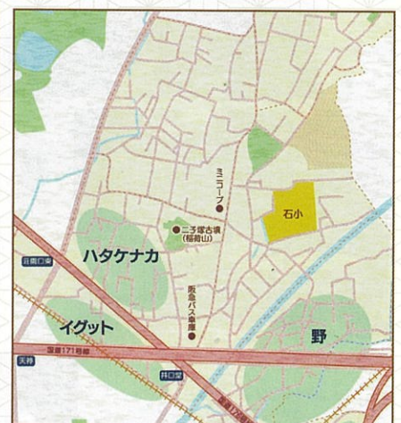
明治の初めごろの井口堂周辺地域 (目印になる現在の名称等は一部記載)