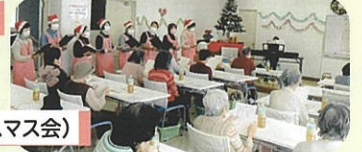
ふれあいサロン(クリスマス会)