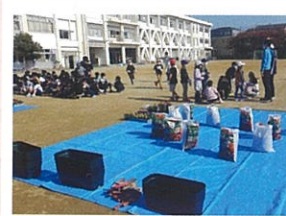
準備(花、土、プランター、等)

11月16日、石橋小学校3年生と石橋地域コミュニティ推進協議会(環境部会)による花一杯運動の一環で、プランターに花と球根を植込みました。当日は天気も良く、みなさんと協力してキンギョソウ、ビオラとチューリップをプランター(ペットボトルキャップの再生品)に植えこみ、水やりも行い楽しい1時間を過ごしました。また、石橋小学校の先生から「太陽、水、空気で育つ植物」の話があり、有意義な授業になりました。学校が美しいと、地域も美しくなります。美しい街づくりに参加しましょう。