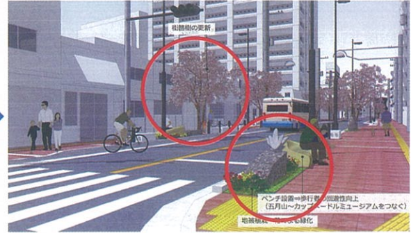
ベンチの設置による回遊性の向上