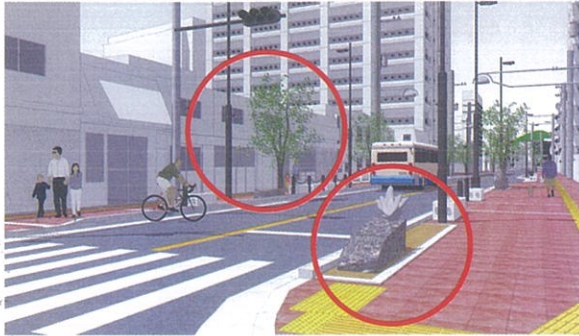
さくら通り植樹柵と街路樹の更新

国からの補助事業として認可されたため植樹柵や桜の街路樹の一層整備をすることにより桜通りのグレードアップをはかる。(1/5~3/15施工予定)