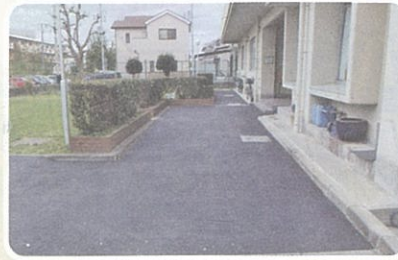
②空港会館前道路舗装事業（9月）