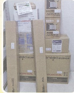
⑤石橋会館緊急避難用 備品設置事業（7月）