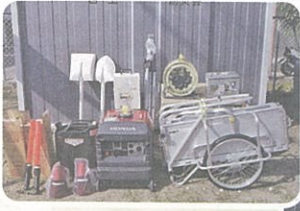
①地域防災体制強化事業（8月） （住吉2丁目公園内）