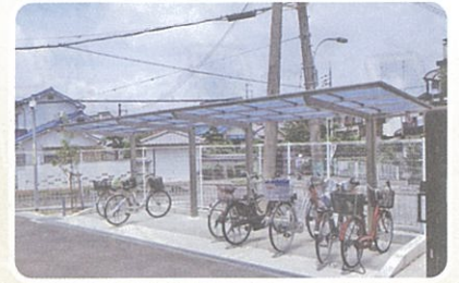
③石橋会館駐輪場屋根設置事業（7月）