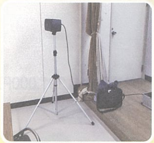
④空港会館内音響設備 設置事業（10月）