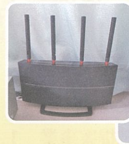
⑥石橋会館内フリーワイファイ 設備設置事業（8月）