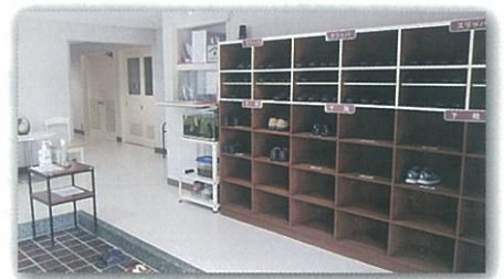
アルコール設置台と新しい靴箱