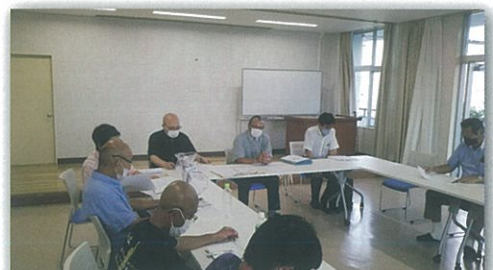
コロナ禍の会議風景 (マスクは必須)