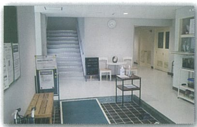
入口ホール(左に曲がればエレベータ)