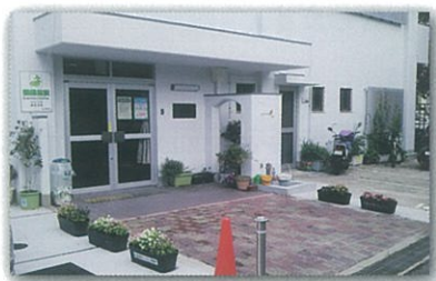
綺麗で明るく広い玄関前