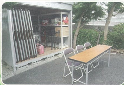
地域イベント備品整備