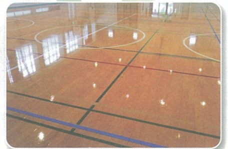
秦野小学校体育館整備