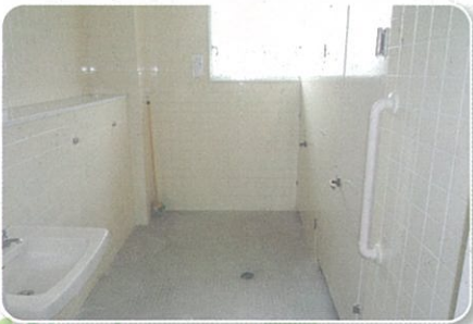
南畑会館トイレ改修