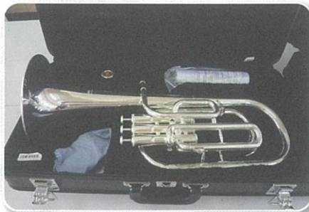
秦野小学校楽器整備