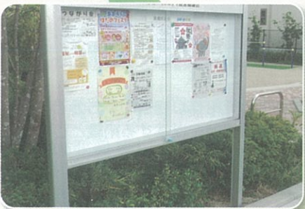
石澄住宅前掲示板設置