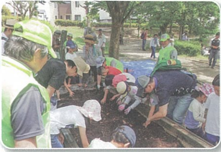
5月 カブト虫の育成事業