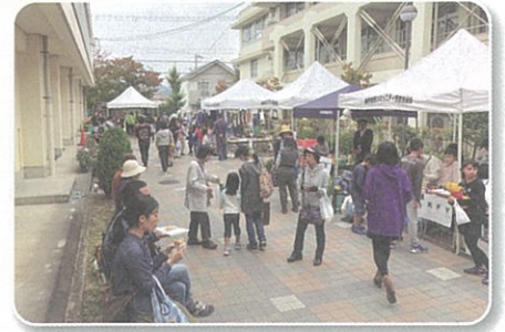
11月 第10回あおぞらdeはたのフェスタ