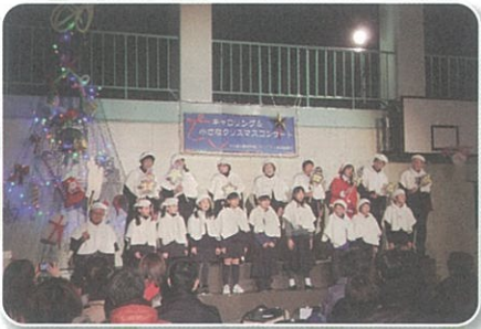
12月 第5回キャロリング &小さなクリスマスコンサート