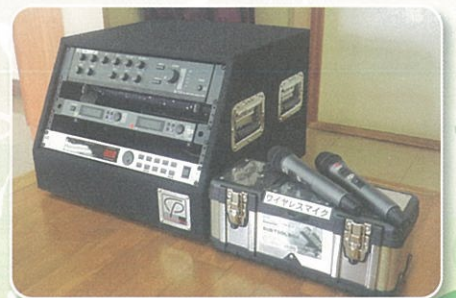
渋谷会館・南畑会館音響整備