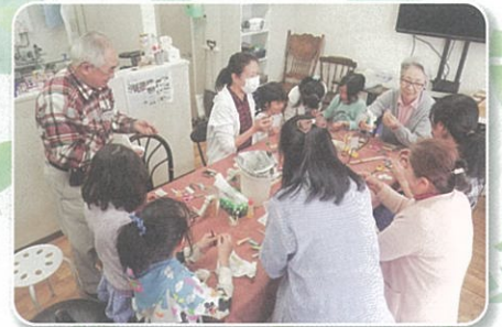
はたのひろば整備及び活用イベント