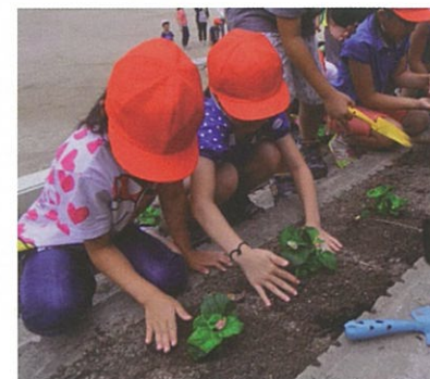
完成した小学校の花壇

6月、五月丘小学校で3年生の子ども達、そしてPTAのお母さん達と一緒に花壇に花を植えました。