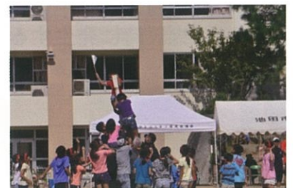
市民レクリエーション大会