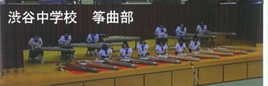
渋谷中学校 箏曲部