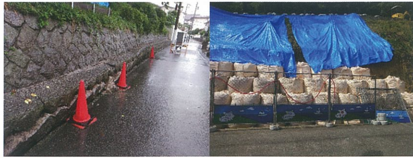
(写真右：応急処置後)

災害の被害を最小限に抑えるには、私達一人ひとりが日頃から災害について関心を持ち、いざという時に落ち着いて行動できるよう、正しい心構えと知識を身につけておくことが重要です。