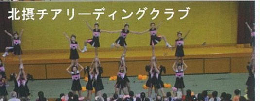
北摂チアリーディングクラブ