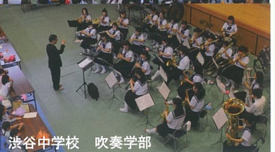
渋谷中学校 吹奏学部