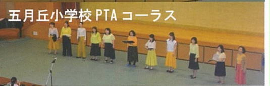
五月丘小学校 PTA コーラス