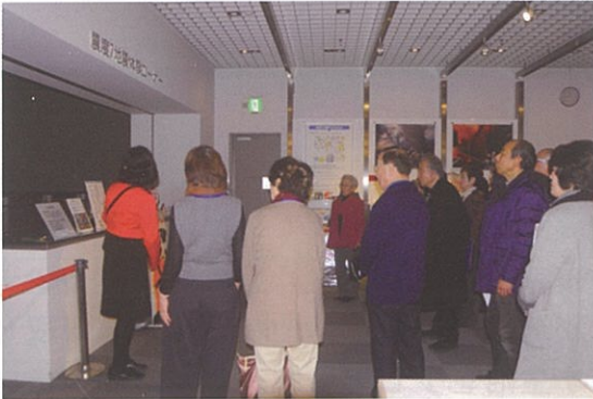
↑ 震度7地震体験コーナー ↓ 初期消火体験コーナー

2月、地域の皆さんと共に総勢36名で大阪市立阿倍野防災センターを見学しました。震度7地震体験や初期消火コーナーなど6つの体験学習ができました。リアルな街並みのセットの中で受けた地震体験は、毎年実施している地域合同防災訓練では経験できない感覚が得られ、今後起こりうる南海地震に対しても一層、自分自身や家族そして地域の人を助けることができるか考えさせられる1日となりました。