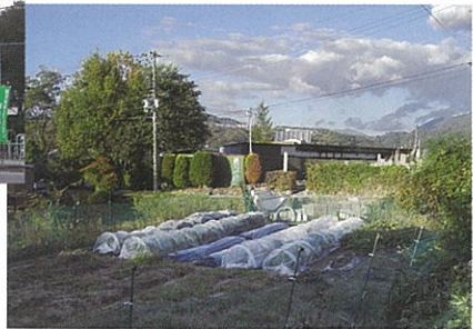
↑ 市民農園 (中川原)