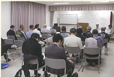
↑ 予算総会 (28年度事業)