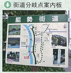
① 街道分岐点案内板