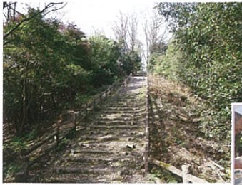
↑ コミュニティ道路整備

業のお別 れ会のア イススケ ートの補 助事業が あります。 無事に終 了するよ うに頑張 ります。