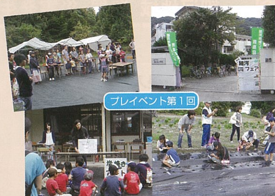
プレイベント第1回

メインイベント 11月29日（日）9時～14時 農園での大根収穫・ミニ運動会・野菜料理試食会・椎茸菌入れ 参加人員（付き添い者・スタッフ含む）（3回延べ）256名