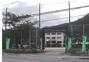
↑ 第5回 細河フェア