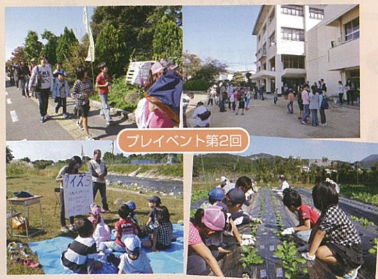
プレイベント第2回