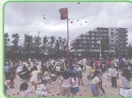
④市民レクリエーション (石橋南小学校) (10月実施)