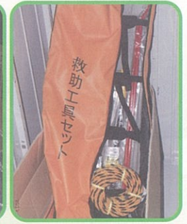
②自主防災倉庫設置並びに資材の充実 (石橋4丁目) (9月実施)