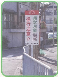
①交通安全対策事業 (空港前) (8月実施)