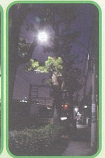
⑤街路灯強化事業 (石橋4丁目) (12月末実施)