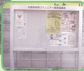
③掲示板設置事業 (空港1丁目) (10月実施)