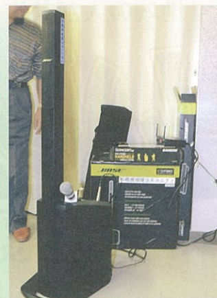
石橋会館用携帯型拡声器設置→