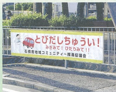
↑ 道路安全飛出し注意幕設置