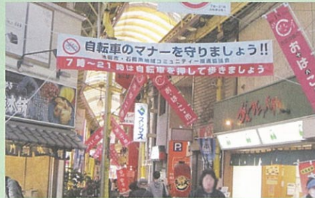
交通安全垂れ幕 9月実施