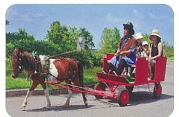
ポニーの馬車は検討中です

花しょうぶを眺めながら のんびりぷかぷかと遊覧しては、運がよければカイツブリなどの水鳥に出会えるかも。