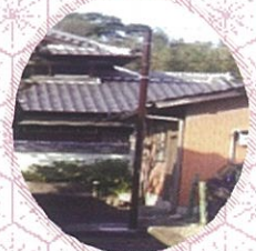
鉢塚2丁目へ街灯を設置しました

鉢塚・緑丘地区コミュニティ推進協議会では、みなさんからの声を募集しています。 「この付近が暗いので街灯をつけてはどうか」「この周辺が危険だから表示をつけたい」 「親子で楽しむこんな行事をやったらどうか」 「小さな自治会では出来ないで みんなでやりたい」 「自治会でみんなが参加できる行事をやりたいが、資機材や人の手が足りない」 など何でも構いません。是非ご提案ください。そして一緒にやってみましょう。