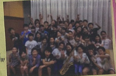
呉服小学校吹奏楽部

テナーサクソのみなさん、ありがとうございます。楽器が大切に保管されることを願っています。