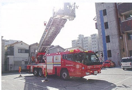
本物のはしご車がやってくる！（予定）