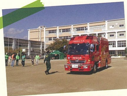
▲消防自動車の間近に見えます!!