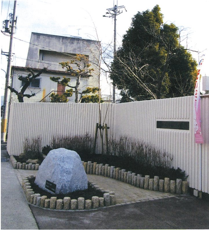
緑化事業／神田小東門前