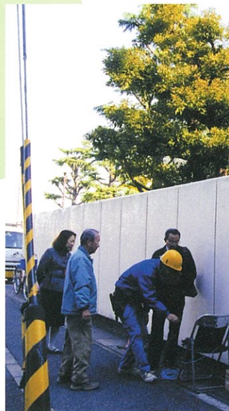
関係者立会で危険箇所に防犯カメラが設置されました。 (24時間対応、神田小南東交差点)