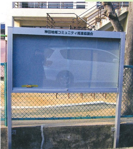
掲示板取替事業／神田会館前他6ヶ所