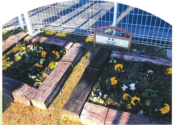
公園緑化事業／神田第一公園 (世話は地域ボランティアによる)