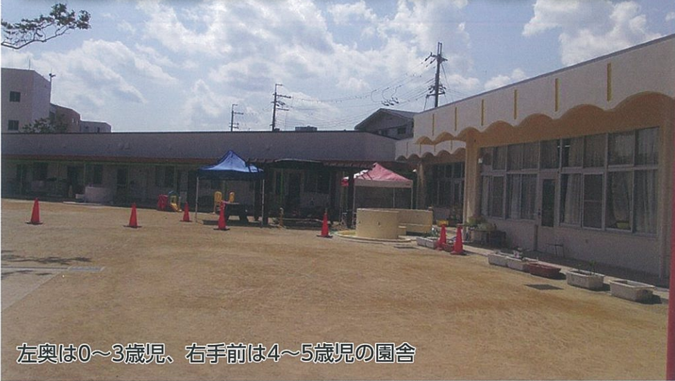
左奥は0～3歳児、右手前は4～5歳児の園舎

平成31年4月1日ひかりこども園は「ひかり幼稚園」と「呉服保育所」を一体化し「幼保連携型認定こども園ひかりこども園」として今年度4月開園しました。保護者の就労などで、長時間の保育が必要な子ども(2、3号認定児)と9:00から14:00の教育時間を園ですぐす1号認定児(4、5歳)と一緒に教育、保育を受けています。0歳児から5歳児まで定員は220名、職員は70名以上。開園時間は午前7:00～午後7:00です。(森田園長)