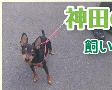
チャッピーちゃん (神田4丁目)