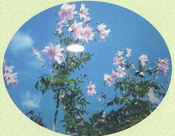
神田花めぐり 神田1丁目

日曜日には主に幼児、平日は幼稚園帰りの親子等に利用されています。皆さん一度お越しください。 (神田3丁目 神田会館前)