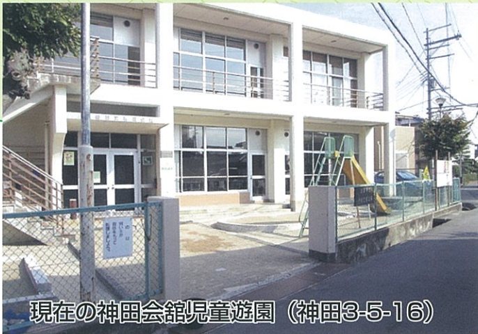
現在の神田会館児童遊園 (神田3-5-16)