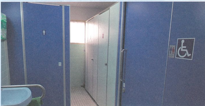
空港会館設備改修事業 (10月実施) 1F・2Fトイレリフォーム