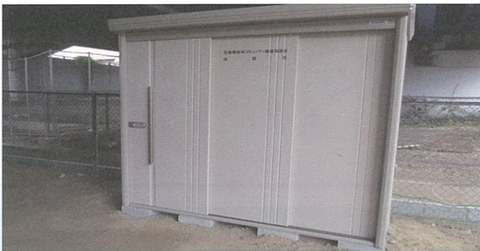
石橋西公園美化事業 (7月実施) 清掃用具保管庫設置