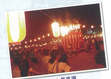
宴も最高潮 ご苦労様!!