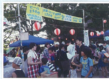
開催宣言 お店販売開始 遊ぶぞ!! 食べるぞ!!一杯だ!!