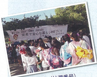
うちわ渡し（抽選番号） これが楽しみ!! 3000枚配布

石橋地域コミュニティとしましては、子どもたちの笑顔の絶えないお祭りを何十年と続けられますよう、皆様方のご理解とご協力を今後ともよろしくお願いいたします。