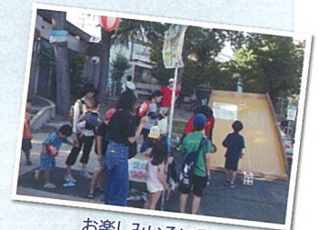
お楽しみいろいろ!!