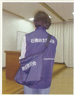
スタッフ訪問時の服装 紺色の服装で巡回します、声をかけてください