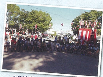
金管演奏 今年はダンス付き!演奏も良いね。