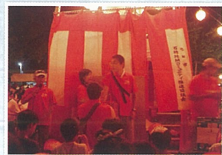
大抽選会 今年は豪華景品!!本数多い。 1等賞 自転車2台（赤色、黒色）