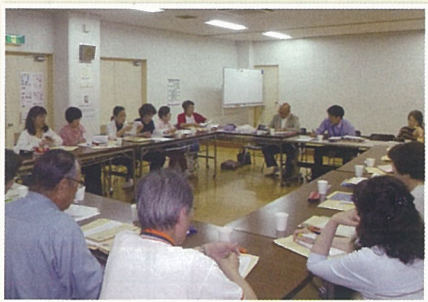
石橋地域避難支援協議会 関係者で情報共有・交換・個別計画の作成等

5月、1回目の戸別訪問を行いました。勧誘やセールスと疑われたりと半信半疑の方もいらっしゃいました。逆に書類を書いてもらいながらおしゃべりが弾み、次回の訪問を（楽しみに）待っているとされたこともありました。（旭丘2丁目は独自の支援体制）