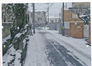
1月には雪が積もっていました