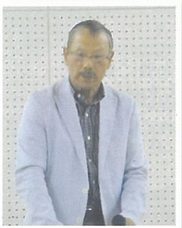
▼松井環境部会会長