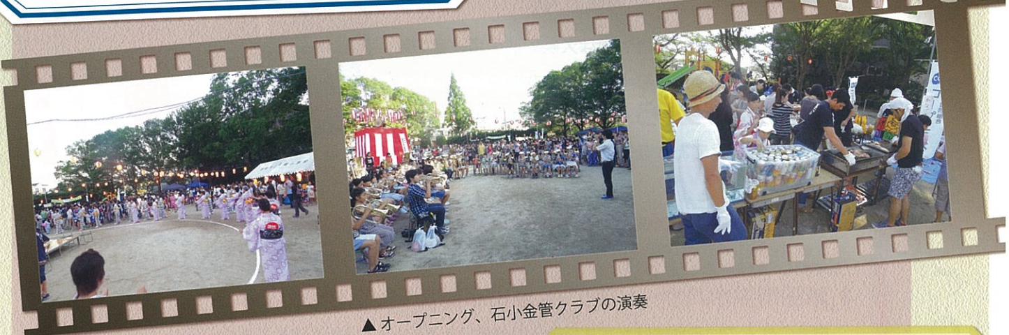
▲オープニング、石小金管クラブの演奏

焼きそば、焼きとり、たこ焼き、フランクフルト、 たこせん、おでん、ちぢみ、わたがし、一銭焼き、 輪投げ、的あて、サイコロ、スーパーボールすくい等