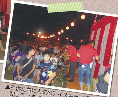
▲子供たちに人気のアイスキャンディーを配っています