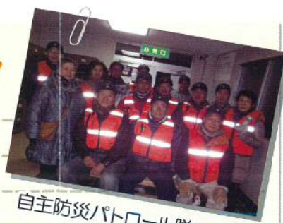
自主防災パトロール隊