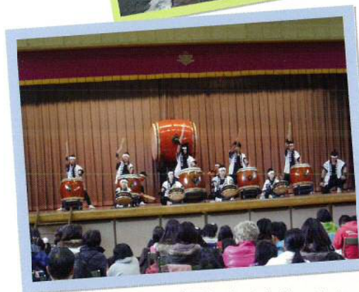
▲ 疾風による太鼓の演奏