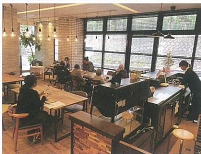
↑ 世代を超えたお茶のみ友達