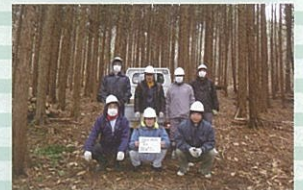
森林山村保全作業