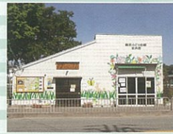
事務所・案内所管理運営