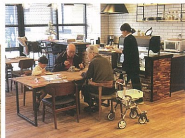
↑ 子供から高齢者まで集まる