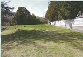
グランドゴルフ場管理運営