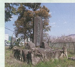
橋本久太郎翁の碑