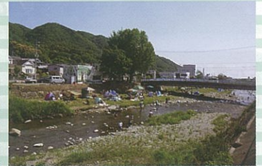
アドプト余野川管理