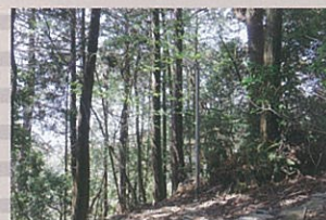
コミュニティ道路