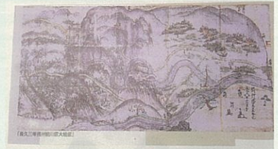
摂州細川庄大絵図