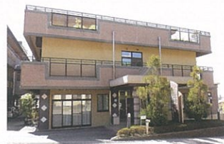
↑ 古江台ホール正面玄関