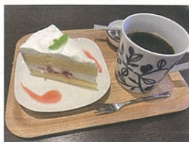
↑ おいしいコーヒ・ケーキ