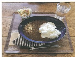
↑ おいしいカレーライス