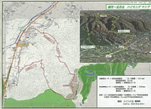
ハイキング道マップ