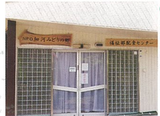
細河配食センター

初めから大切に守っている見守りと声掛けを常に心がけて、私達も利用者さんから元気を頂いたり、笑顔でのつながりを楽しみに頑張っています。