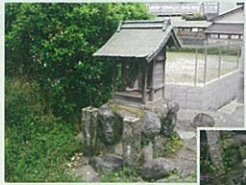
細い道を左北に進む

それでは余野街道を歩いてみたいと思います。余野街道が能勢街道から分岐するところは新町の道標の辺りと考えられます。その道標の指示の通り右側の山沿いの細い道を北に進みます。しばらく歩くと国道と合流してしましますが、木部の信号の所で右手に折れ、最初の角を左に曲がります。東側には紀部神宮、曹洞宗の永興寺が位置します。永興寺には平安時代後期(約1100年前)