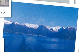
フィンランド フィヨルド