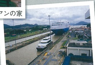
パナマ共和国 パナマ運河