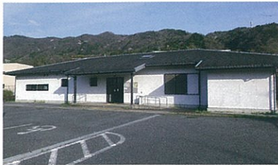
市立 細河コミュニティセンター全景

細河地域各種団体の活動にまたダンス教室・料理教室・キッズの教室・住民の憩いの場として利用して頂けます。