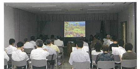
細河振興構想研究会

今後も細河地域が活力ある街になるようメンバー全員頑張りますので、よろしくご協力をお願いします。