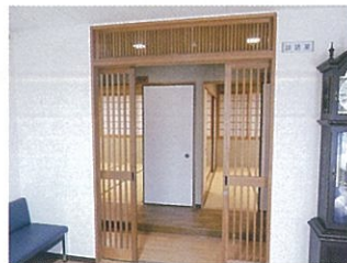
談話室 (和室) 2室