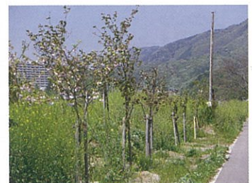
余野川堤防敷桜植栽