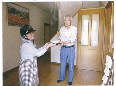
福祉配食サービス

また、ほそごう学園の発足に合わせ、「ほそごう地域コミュニティ（細河地区）」に名称変更になりました。今後は伏尾台地区との共通課題や、この地域に見合った新たな活動を計画していったらと考えております。皆様におかれましては、お気軽に、みどりの郷事務所にお立ち寄り下さい。