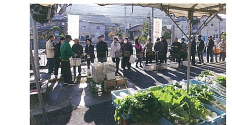
野菜朝市開始 (当初)

協議会発足当時、この細河地域にどうしたら多くの人が集まってもらえるか、検討を重ねました。何百年も続く植木産業を取り入れた、町起こしも種々検討されました。近年、植木の需要が特に減