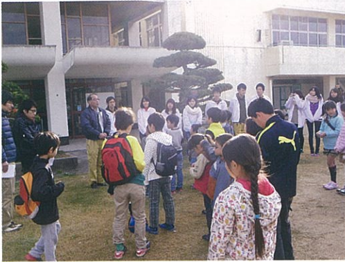
細河フェア（旧細小を拠点）