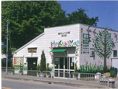
細河地域コミュニティ推進協議会事務所 & 細河みどりの郷観光案内所