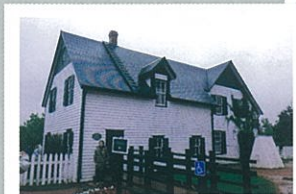
カナダ 赤毛のアンの家