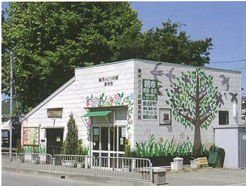
細郷地域コミュニティ推進協議会事務所 & 細河みどりの郷観光案内所

平素はコミュニティ活動にご支援いただき有難うございます。様々な事業を行い十年を迎えることができました。協議会の事業は「虫の育成や炭焼き・椎茸栽培など自然を守る活動」「子供会育成・余野川や里山での自然学習」「細河PR・世代間交流・学校給食への細河野菜の提供・細河フェア」「野菜販売・遊休地を利用した市民農園」「高齢者や妊婦さんへの声かけや子育て配食」「コミュニティ道路や五月山へのハイキング道の整備」「グラウンドゴルフ場の運営」等々展開してまいりました。今後も私たちの活動は、古くからの産業、伝統や文化の中で多くの人々が往来する街、大都市近郊の自然の中で、のびのびと子供たちが遊ぶ姿を思い、「環境保全・教育の充実・特産物づくり」等々細河地域ならではの取り組みをしてまいります。活動に参加してみようかな、と思われる方は「細河みどりの郷」にお声かけください。お待ちしております。