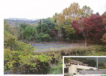
細河果樹園 (ブルーベリー)

細河ふれあい観光事業は、関西大学と共に、昨年度同様にイベント(細河フェア)を行い、年々参加者が多くなっています。今回も学校給食へ大根・人参・小松菜を出荷いたしました。補助事業の細河まつりも盛大に取り行われました。細河ふれあい農園事業とし、東山町での市民農園も開設し、皆様に喜んで頂いています。また果樹園(ブルーベリー摘み取り園)も、もっと規模の拡大をしようと思っております。