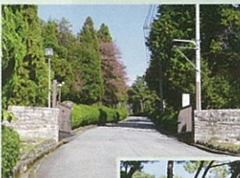
ゴルフ場敷地入口