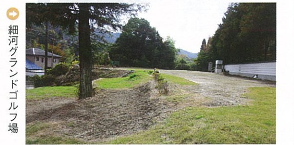
細河グランドゴルフ場