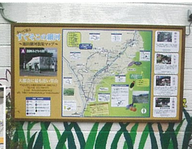
細河みどりの郷案内看板更新

広報誌、第一号(平成二〇年)の発行から九年が経過し、今回は第一九号の発行となります。地域住民の方々に広報誌「細河地域「ミニメディアニュース」の感想を聞く」と時々市報に折り込まれる地域広報紙で「しょうぐら」の返答が多く、そろそろ広報誌の見直し(レイアウト)が必要な時期に来ているのかな、と感じています。住民の皆さまの納めた税金にて活動している組織であり、やはりその団体の活動状況を中心とした、内容の紙面となるのは否めないところであり、次号、第二十号は費用を少し増やして頂き、「十周年記念号」の発行を予定しています。 多くの地域住民の方々に、見てもらえる広報紙にしようと広報部員一同、頑張っております。