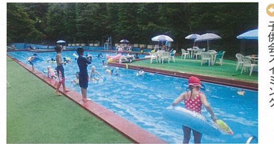
子供会スイミング

今年度は四月からグランドゴルフ場の再整備を行い、利用者に喜んでいただきました。また、七月には子供会育成事業で不死王閣の協力いただきプールで楽しく交流ができました。十月には細河地域花いっぱい事業として、細郷中学校にて花苗を植え育て細河・伏尾台地区の施設等に配る予定をしています。今年度のコミュニティ道路整備事業は街路灯五基設置する予定をしています。来年度も本事業は継続していきたいと考えています。