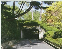
ゴルフ場内トンネル