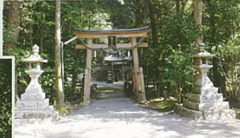
細川神社境内 細川神社石碑