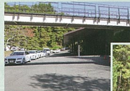
クラブハウス前道路