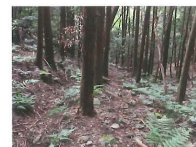
道標番号: 9まで急な登り坂