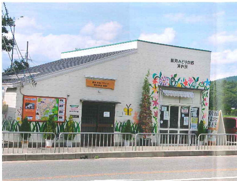
みどりの郷 案内所