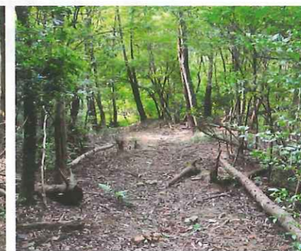
道標番号: 11までの道