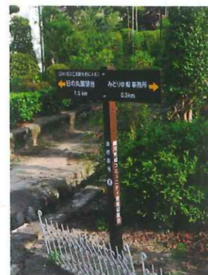
道標番号: 6 (次の三叉路を右に入る)